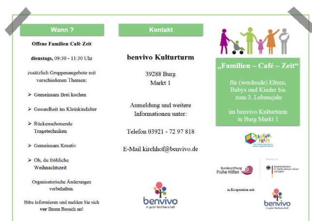
Flyer benvivo | Familien-Cafe-Zeit

Das Beratungszentrum CJD in Genthin wird zeitnah ein Eltern-Kind-Angebot zur Förderung der Sensomotorik von Babys und Kleinkindern in Form einer Eltern-Kind-Gruppe anbieten. Informationen zum Angebot folgen zeitnah und sind auch direkt über das Beratungszentrum zu erfragen.