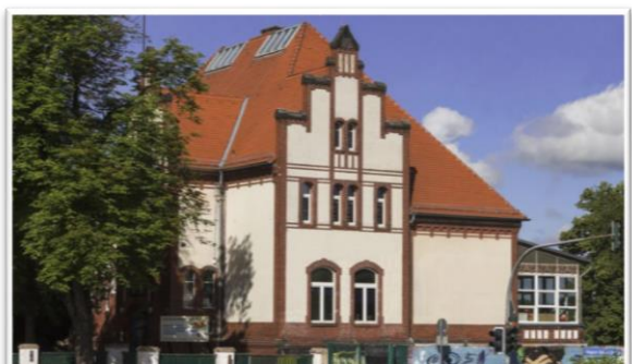
Frauenaktionstag 30.09.22 SoKuZ Burg