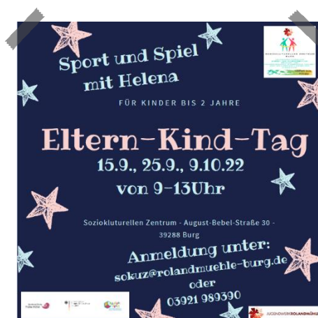
Flyer SoKuZ | Eltern-Kind-Tage

Ein weiteres Angebot ist die offene Familien-Café-Zeit im benvivo Nachbarschaftstreff in Burg. Hier können sich jeden Dienstag Eltern mit ihren Schützlingen treffen, in den Austausch kommen und die verschieden angeleiteten Angebote in Anspruch nehmen.