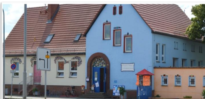
Frauenaktionstag 29.09.22 Thomas Morus Haus Genthin

Viele Anbieter von sozialen Leistungen, Projekten und Beratungsangeboten aus dem Landkreis werden vor Ort sein und auf ihre Hilfen und Dienstleistungen für Familien aufmerksam machen. Unter anderem wird die Suchtberatungsstelle demonstrieren, welchen Einfluss verschiedene Suchtmittel auf den Körper haben und wie sich der Konsum auf die Persönlichkeit und Beziehungen auswirken kann. Die Beratungsstelle „Wildwasser e.V.“ berichtet über grenzüberschreitendes Verhalten und zeigt ihr Angebotsspektrum auf. Neben vielen weiteren Ansprechpartnern und Angeboten wird eine professionelle Rechtsberatung für Familienrecht vor Ort sein, welche für unterschiedliche Themenfelder von den Besuchern befragt werden kann.